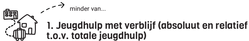
Jeugdhulp met verblijf als % van de totale jeugdhulp (0-23 jaar)

Beweging: Kinderen worden 'thuis' geholpen en als dat niet kan, is 'thuis' onderdeel van de hulp of ondersteuning die gezinsgericht is vormgegeven.