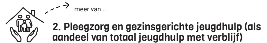
Uitgesplitst naar verblijfsvorm (0-23 jaar)*

*Residentieel + overig = De jeugdige verblijft op de accommodatie van de jeugdhulpaanbieder, veelal in een groep met andere jeugdigen. In feite betreft het alle vormen van verblijf die niet onder een van de voorgaande categorieën vallen. Hieronder vallen ook begeleid wonen en kamertraining. Deze hulpvormen vinden doorgaans plaats in een verblijf van de hulpaanbieder.